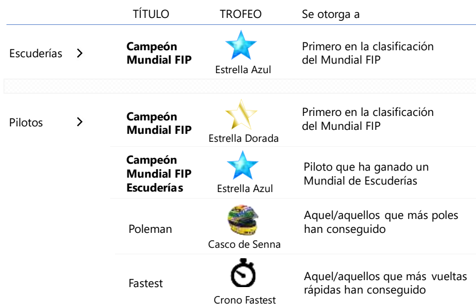
Figura 1: Títulos Oficiales

Los trofeos correspondientes a estos títulos se suelen mostrar al lado del nombre del galardonado.